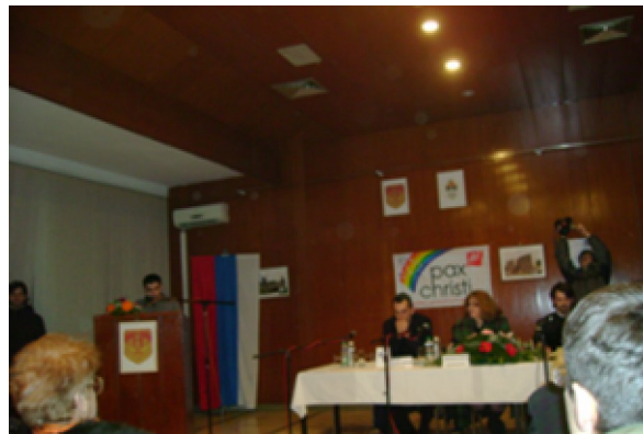
Prezentacija „Međureligijskog kalendara 2009. god“.