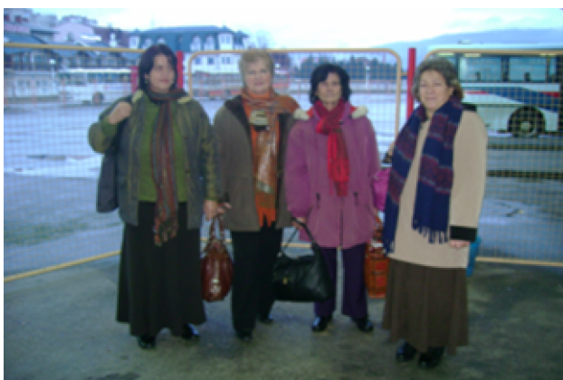
Žene odlaze u banju Fojnica.